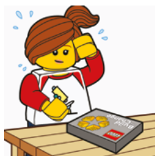
Lær om en udfordring fra den virkelige verden.

"Build The Change is an event where we inspire children to use their imagination in a fun, social and environmental context, and where we foster their creativity and promote social interaction. It's a tool within a framework, but with open ended solutions in a hands-on, minds-on fun experience."