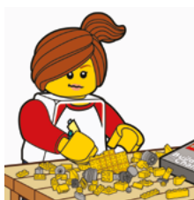
Udtænk din egen geniale løsning.