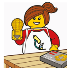
Del din løsning med andre.

Du kan se et eksempel på workshoppen her: youtube.com/watch?v=Q6_laT1Ohks